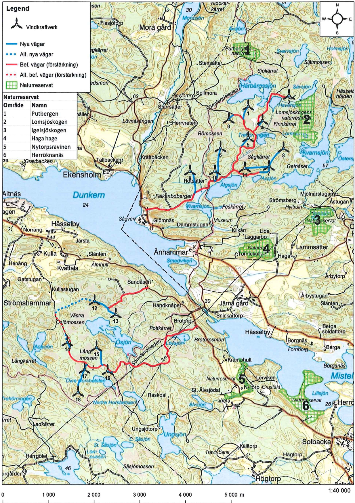
Figur 2 – Terrängkarta 1:40 000, naturreservat