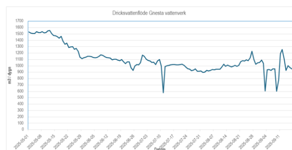
BILD: Aktuell dygnsförbrukning.

Nivåerna i vattentornet är åter uppe på normala nivåer. Efter lagning av vattenläckorna förra veckan har genomsnittsproduktionen minskat till ca 950 kbm/dygn. Arbetet med att söka vattenläckor pågår kontinuerligt. Grundvattennivån sjunker fortsatt sakta, men kommer allt närmare kritiska nivåer.