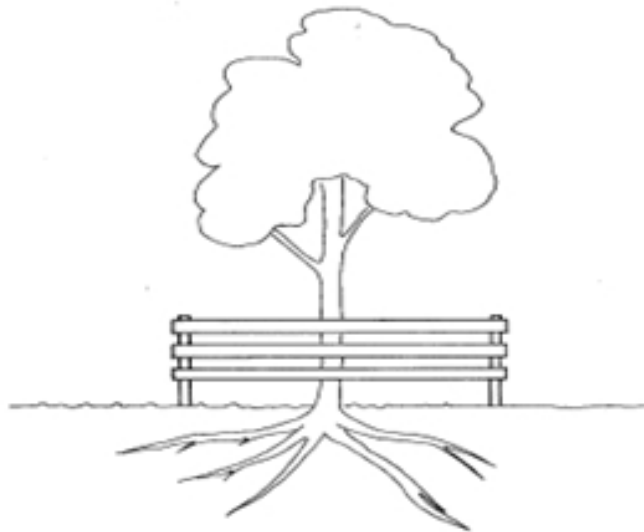
FIG 2: INPLANKNING AV TRÄD FÖR ATT SKYDDA SJÄLVA STAMMEN