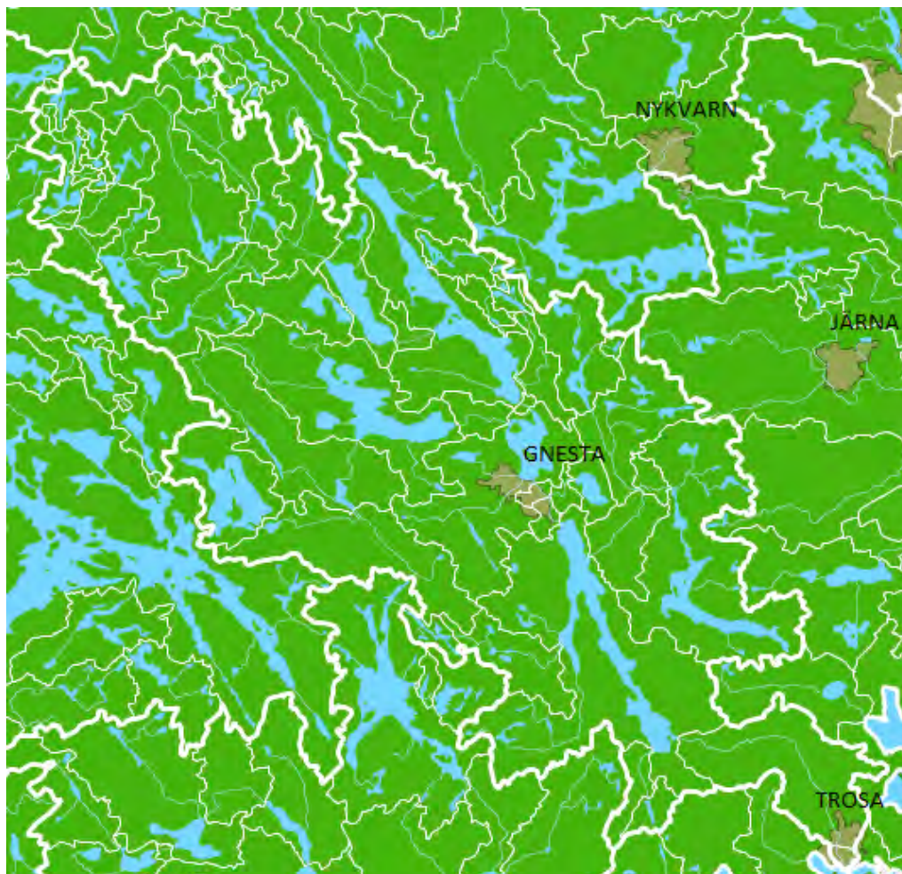
Figur 2. Karta över Gnesta kommun med omnejd där avrinningsområdena för varje sjö eller vattendrag finns avgränsat (SMHI 2012).

I samband med avloppsinventeringen sker även tillsyn av lantbruk. Tillsynen av lantbruk sker i syfte att minska utsläpp av växtnäringsläckage. Genom tillsyn av lantbruk och avlopp inom samma område förväntas utsläppen av näringsämnen minska betydligt. Denna samlade syn är en del av uppfyllande av Gnesta kommuns lokala miljömål, vilka man kan läsa om i bilaga 1.