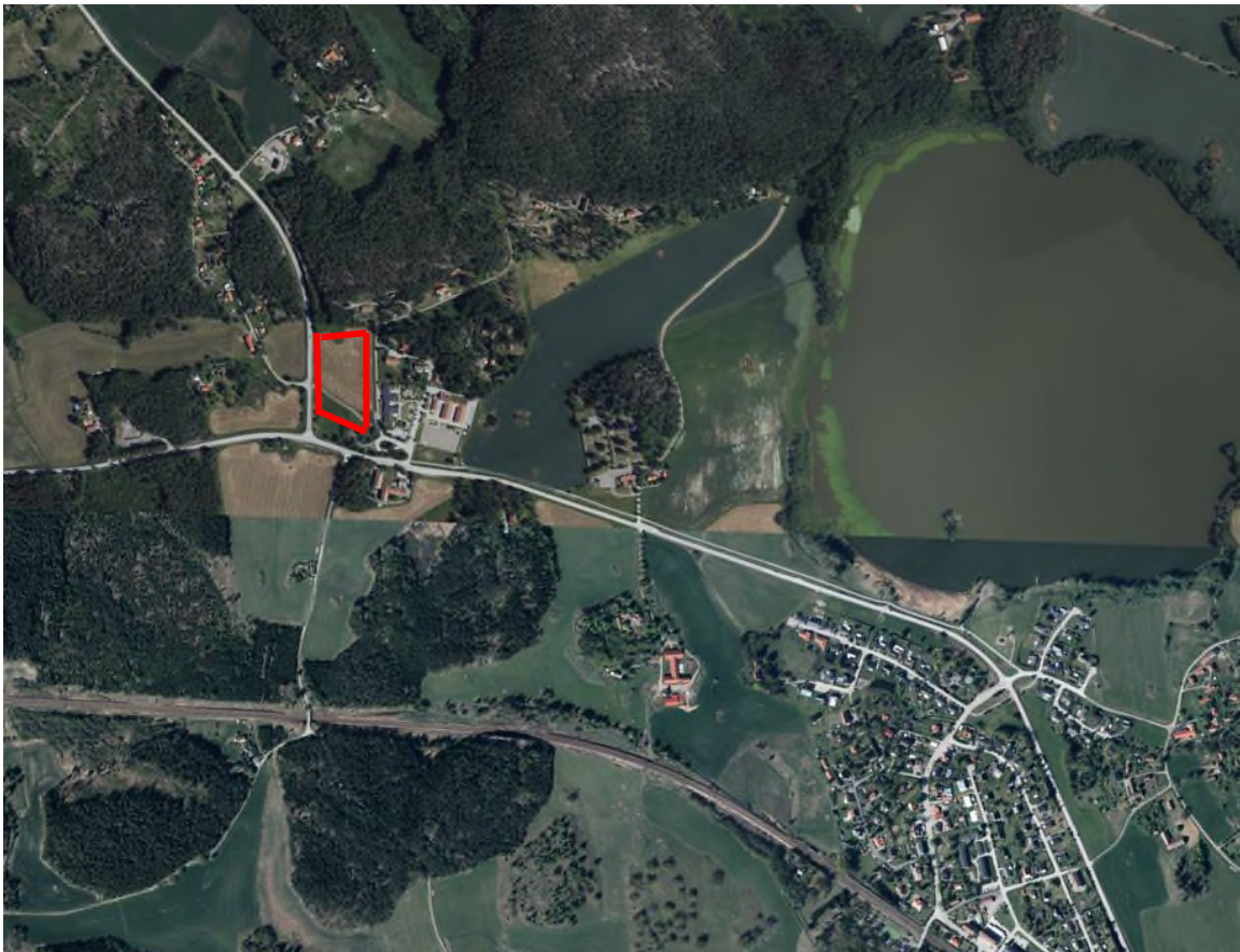
Figur 1. Översiktskarta där röd rektangel visar undersökningsområdets ungefärliga läge (Eniro, 2022).

Det aktuella området för nybyggnation omfattar ca 2 hektar mark. Området är beläget ca 800 meter nordväst om Björnlunda tätort i Gnesta kommun, se Figur 1. Området utgörs till största del av jordbruksmark/åkermark. Närmsta vattendrag ligger ca 800 meter österut och utgörs av Kyrksjön. Öster om det aktuella området ligger en skola. Det har inte framkommit om området nyttjats till annan verksamhet. Enligt Länsstyrelsens MIFO-databas över potentiellt förorenade områden (EBH-stödet, utdrag 2022-05-17) finns inga identifierade objekt inom 1 km radie. Historiska flygfoton från 1955-1967 visar att marken använts som åkermark (Eniro, 2022).