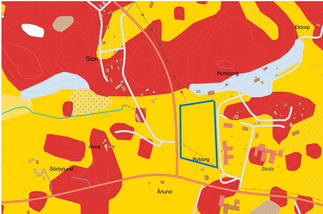
FIGUR 2. JORDARTSKARTA ÖVER DET AKTUELLA OMRÅDET (SGU, 2022). BLÅMARKERAT OMRÅDE VISAR UNGEFÄRLIGT LÄGE FÖR AKTUELLT UNDERSÖKNINGSOMRÅDE.

Enligt SGUs kvartärgeologisk karta (Figur 2) utgörs marken vid aktuellt område av glacial lera (mörkgul färg).